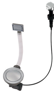
自动下水器 Space - PE 8407 109