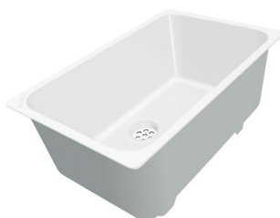
白托盘 8153 100