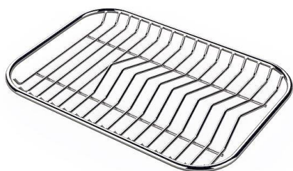
不锈钢背板 8100 154