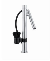
龙头 Bert 8428 100