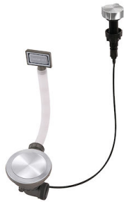
Milano 自动下水器 Space 8407 115