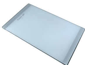
玻璃砧板 8631 300