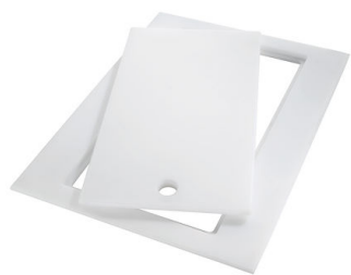
HPDE Twin 砧板 8644 101