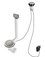
自动下水器 Space - PL 8407 117