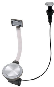
自动下水器 Space - PP 8407 116