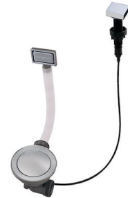
自动下水器 Space - PA 8407 108